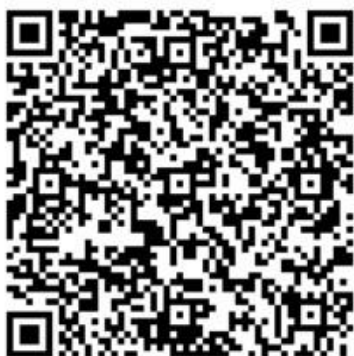
臺中市避難處所清單