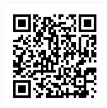
臺中市政府警察局官方LINE

(三)搜尋Line「臺中市政府警察局」或掃描下方QR Code圖示，加為好友，查詢所在最近的避難處所。