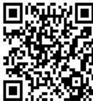
臺中市急救責任醫院清單