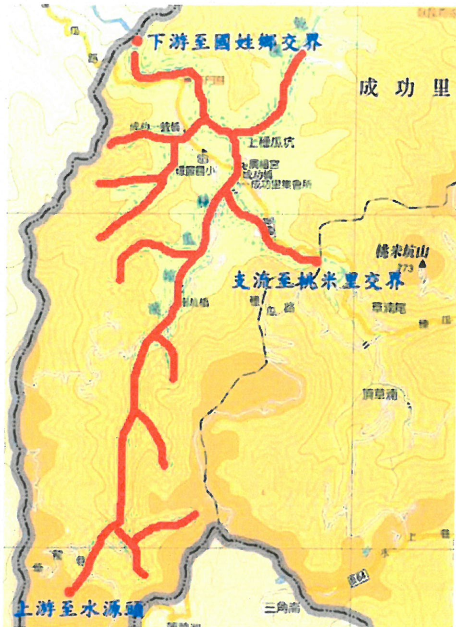
南投縣埔里鎮成功里種瓜坑溪河川流域禁漁範圍圖